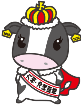
ホルスタイン共進会 マスコットキャラクター みなみかぜ 南風ミル

2020年10月に宮崎県で開催される第15回全日本ホルスタイン共進会 九州・沖縄ブロック大会のマスコットキャラクターです。