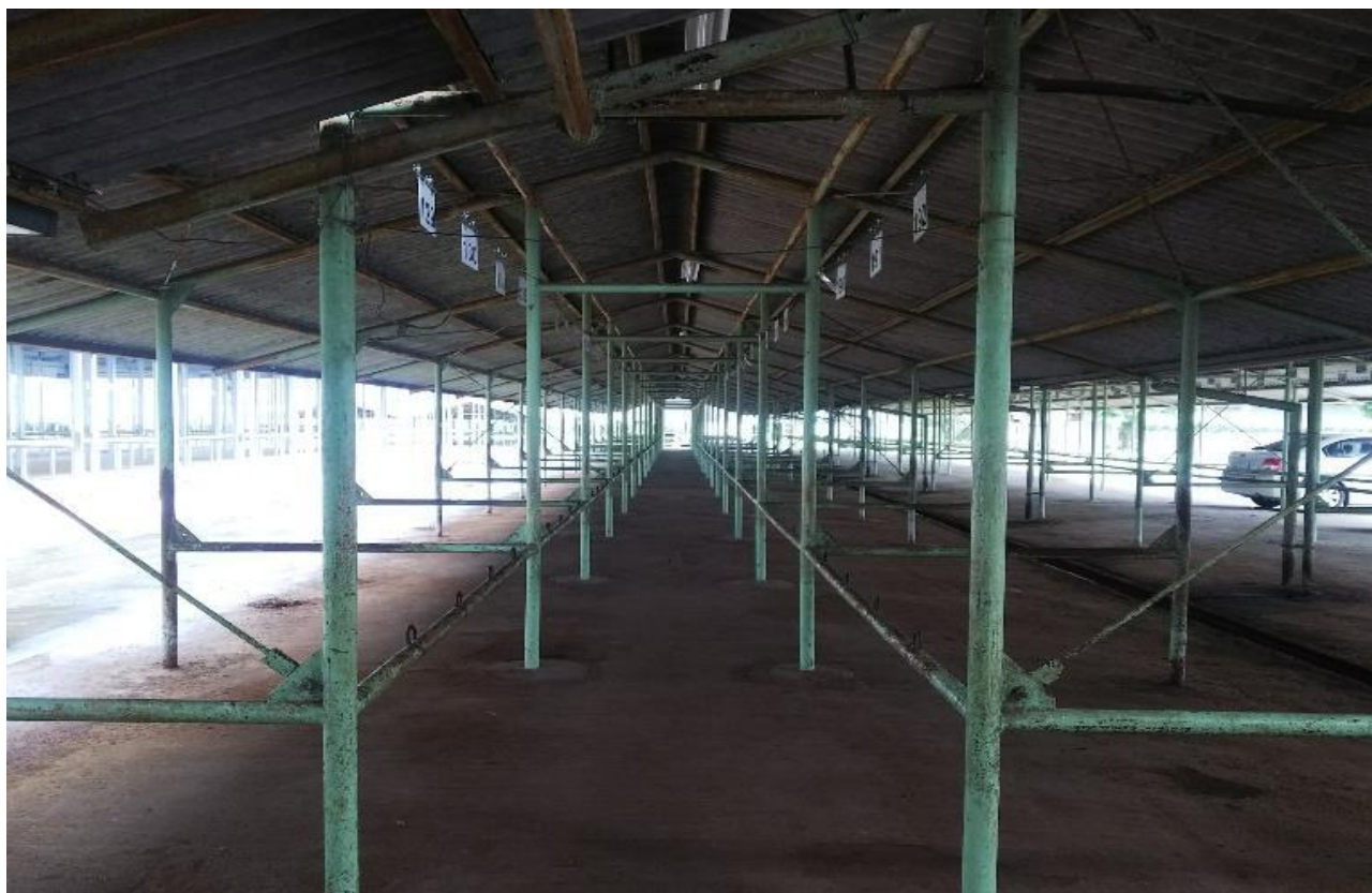
屋内小間B 1小間パネル設置 イメージ