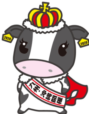
ホルスタイン共進会 マスコットキャラクター みなみかぜ 南風ミル

2020年10月に宮崎県で開催される第15回全日本ホルスタイン共進会 九州・沖縄ブロック大会のマスコットキャラクターです。